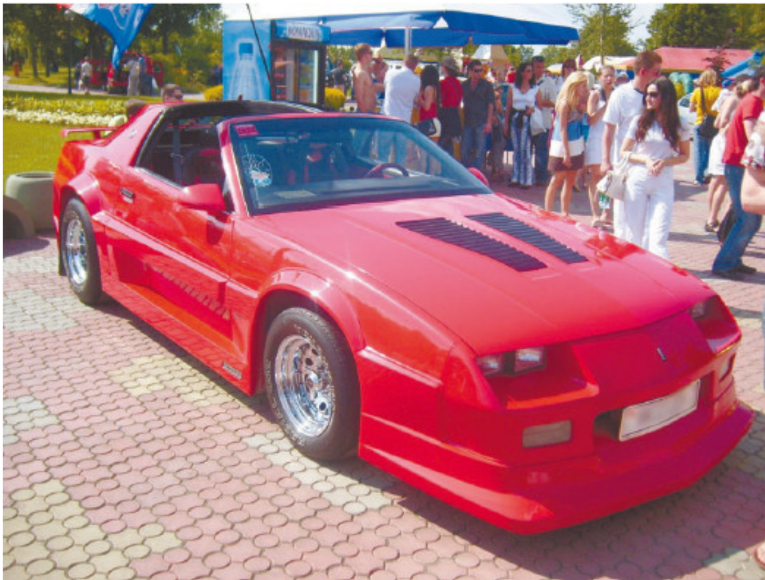
Рис. 1.27. Такой автомобиль для перевозки картошки не годится

ния и различных расходов. Кроме того, одно дело – поездки на работу в городе, другое – рейсы на дачу за мешком картошки. Приобретая иномарку для того, чтобы ездить на ней в лес за грибами, можно сделать огромную ошибку – у большей части иномарок весьма невелик дорожный просвет (в том числе и у «паркетников») (рис. 1.27). Поэтому российские проселочные и лесные дороги только разбивают подвеску автомобиля. В то время как отечественная машина совершенно спокойно чувствует себя на этих дорогах.