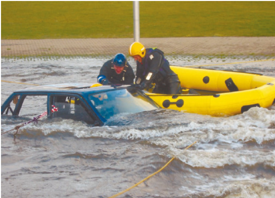
Рис. 1.13. Спасение «подводных лодок» – дело рук спасателей

На дорогах нашей страны становится все больше автомобилей, прибывших из затопляемых районов. Так сказать, машин, побывавших в роли подводной лодки (рис. 1.13).