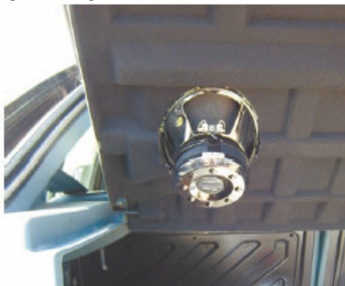
Рис. 1.7. «Всего» $300 – и вы становитесь счастливым обладателем акустической системы в крышке багажника

Как известно, дороже всего нам обходятся излишества. Это в полной мере касается и автомобилей. Многие дополнительные «примочки», которые никак не влияют на эксплуатационные качества автомобиля, стоят немалых денег. И продавцы, особенно в автосалонах, всеми силами стремятся убедить покупателя, что просто невозможно жить без боковых порогов, обтекателей и т. д. Они стремятся установить на покупаемый автомобиль как можно больше дополнительного оборудования (рис. 1.7), ведь их зарплата зависит не столько от количества проданных автомобилей, сколько от вырученных сумм, так что увеличить любыми путями стоимость машины в их прямых интересах.