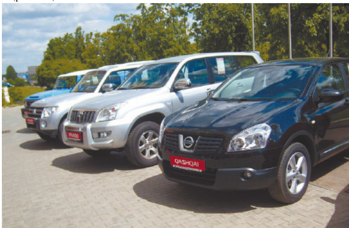
Рис. 1.24. Даже выставка автомобилей около автосалона снижает цену машины за счет хранения на открытом воздухе

Начинающий автовладелец, приобретая новый автомобиль, мотивирует такую покупку часто еще и тем, что впоследствии он сможет перепродать машину, практически не потеряв в цене. Вот только автомобиль начинает стремительно дешеветь с того момента, как сходит с конвейера. Выезд за заводские ворота – это уже потеря в цене, ведь с этой самой секунды модель начинает устаревать! Ну а уж если к этому прибавляется эксплуатация, то и говорить нечего (рис. 1.24).