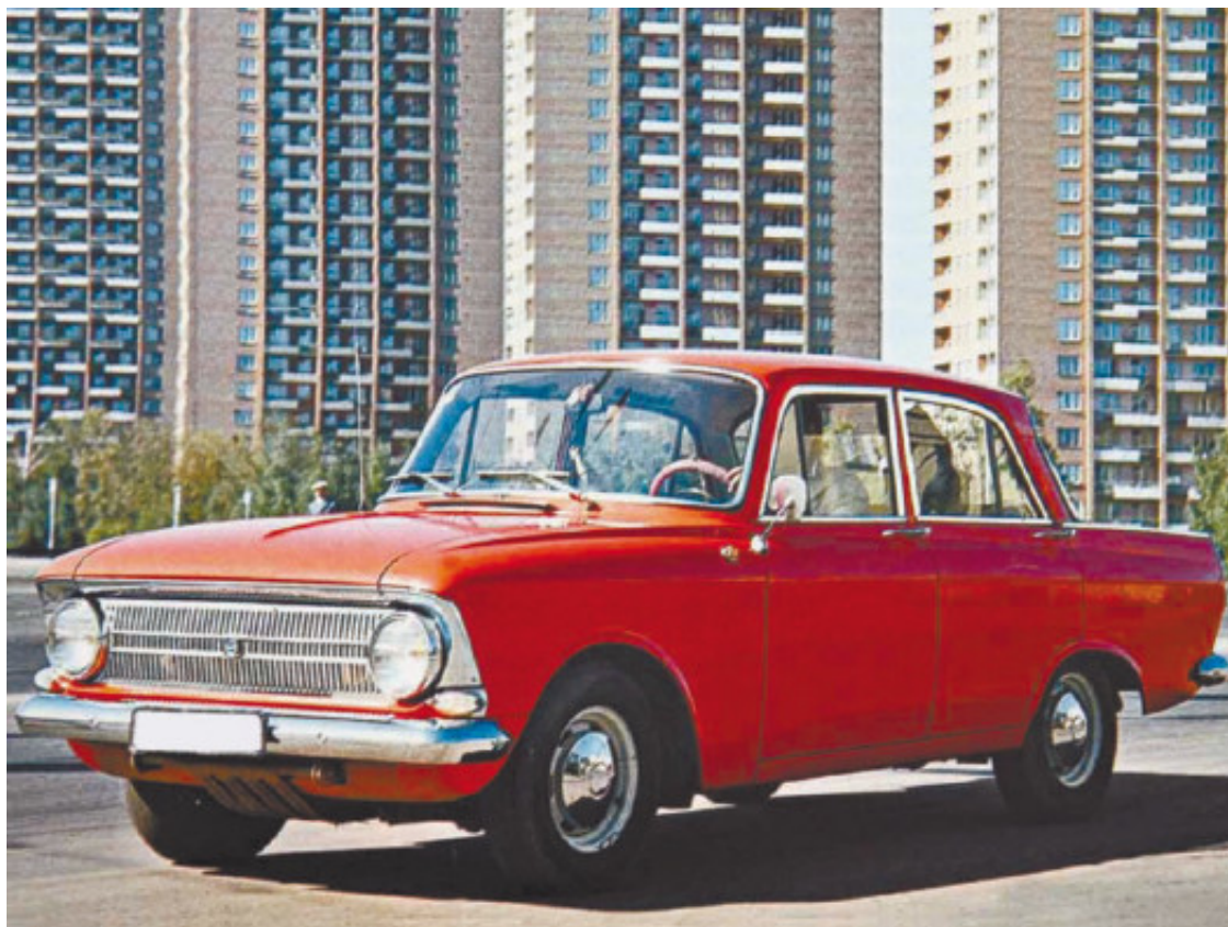
Рис. 1.26. «Москвич-412» – легенда отечественного автопрома

Правда, есть один эксплуатационный нюанс, в котором отечественные автомобили оказываются дороже иномарок, – расход топлива. Увы, свои «кони» «кушают» побольше, причем на 20–25 %, чем иномарка. При нынешних ценах на топливо это весьма существенно. Но есть выход из положения – газовое оборудование. Перевод отечественного автомобиля на систему «газ/бензин» снижает расходы на топливо (опять же на систему «газ/бензин» можно перевести и иномарку, но мало у кого поднимается на это рука, разве что на сильно подержанную иномарку солидного возраста, но такие и «кушают» гораздо больше своих более молодых собратьев).