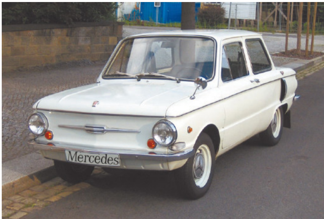
Рис. 1.11. Не верь глазам своим!

Знаменитый афоризм Козьмы Пруткова утверждает: «Если на клетке со львом написано «Осел» – не верь глазам своим!» (рис. 1.11). Таким же образом следует относиться к любой информации, которую сообщает продавец, особенно если он делает это совершенно добровольно и даже навязчиво. Если вас при покупке автомобиля одолеет приступ здорового скептицизма, то это лишь добавит шансов не ошибиться и приобрести машину, что называется, с открытыми глазами.