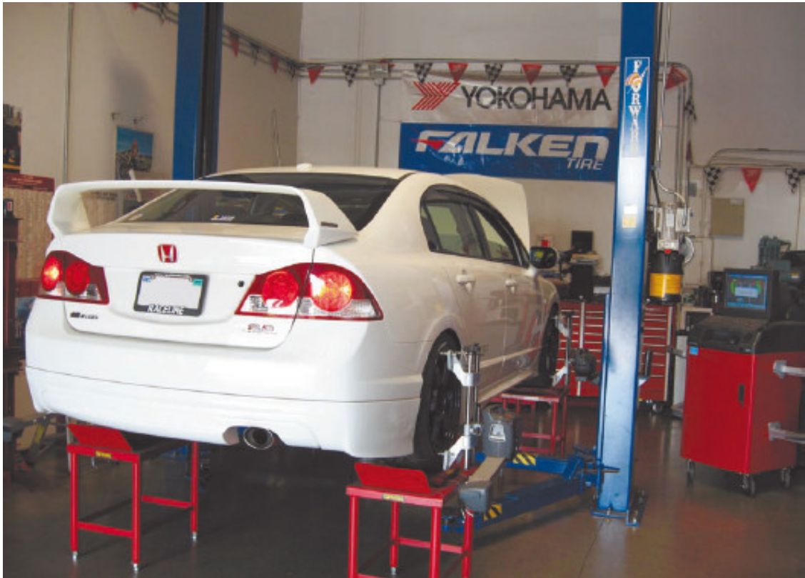
Рис. 1.12. Регулировка развала и схождения колес на СТО

геометрия или по крайней мере серьезно повреждена подвеска, вследствие чего автомобилю необходимо делать дорогостоящий ремонт.