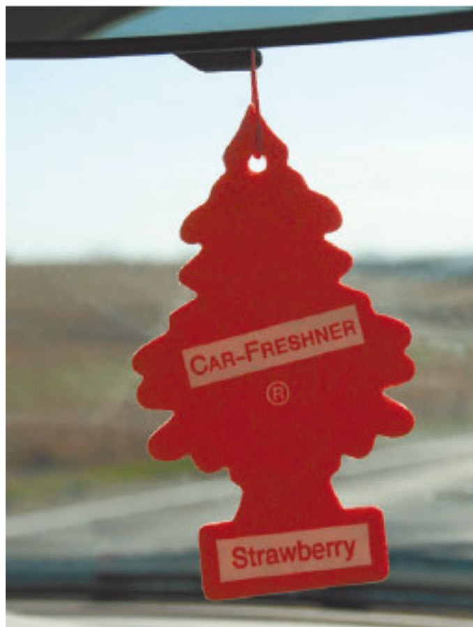
Рис. 1.14. Автомобильный освежитель воздуха «елочка»

А ведь распознать «утопленницу» можно было и не выезжая с авторынка. Первое, что выдает «искупавшийся» автомобиль, – запах в салоне. Если в салоне не слишком «поношенного» европейского автомобиля имеется ароматизатор (рис. 1.14), но при этом все равно неизбежно пахнет сыростью и гнилью, можно больше уже ни на что не смотреть. Этот автомобиль тонул, и покупать его ни в коем случае нельзя.