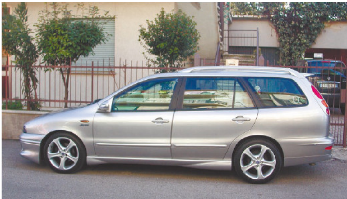
Рис. 1.9. Универсалы любят дачники и путешественники

Но основная «засада» с навязчивым сервисом поджидает неопытных покупателей вовсе не около дополнительного оборудования, а рядом с самим автомобилем. Вы приходите в автосалон или на авторынок с целью приобрести машину. Если у вас нет иммунитета к настойчивости продавцов, то вас смогут убедить, что тот автомобиль, который вы осматриваете в данную секунду, и есть машина вашей мечты. И совершенно неважно, что вы всегда мечтали о седане, а вам навязывают универсал (рис. 1.9) – грамотный продавец найдет множество обоснований, почему именно универсал является для вас наилучшим выбором, и то, что вы купили не ту машину, вы сообразите, уже только приехав на ней домой.