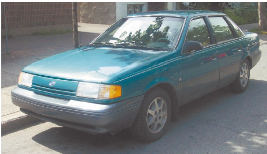
Рис. 1.1. Ford Tempo образца 1994 года

Ожидание нужной запчасти длилось три месяца. Автомобиль стоял «на приколе», ведь даже новичку ясно, что эксплуатация машины без пыльника приведет к неминуемому выходу из строя того узла, который предназначен защищать пресловутый кожух, и тогда ремонт выльется в просто невообразимые деньги.