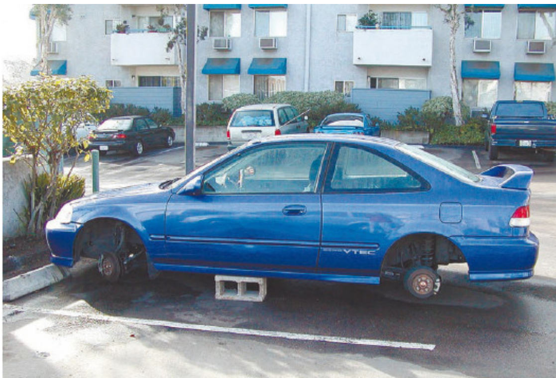
Рис. 1.21. «Разутый» автомобиль

Автомобиль б/у тоже нуждается в сигнализации – хотя бы для того, чтобы его не взяли «покататься на время», «не разули и не раздели» (любителей автомобильной резины, комплектов инструментов и аудиотехники предостаточно) (рис. 1.21). Но сигнализация может быть значительно проще, чем для новой машины. В некоторых случаях достаточно просто отключателя массы (если автомобиль достаточно солидного возраста). И машину можно смело оставлять около офиса или магазина. По крайней мере, серьезных автоугонщиков такой автомобиль вряд ли заинтересует (если, конечно, это не раритетный Ferrari).