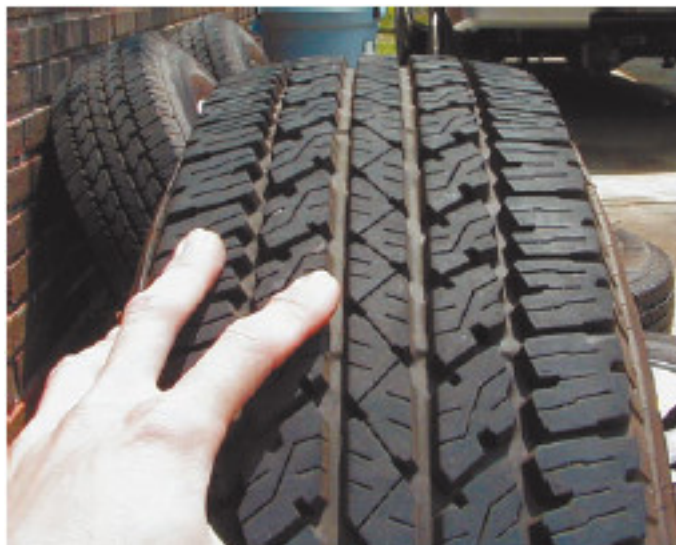
Рис. 1.6. Проверяйте покрывки, не отходя от кассы!