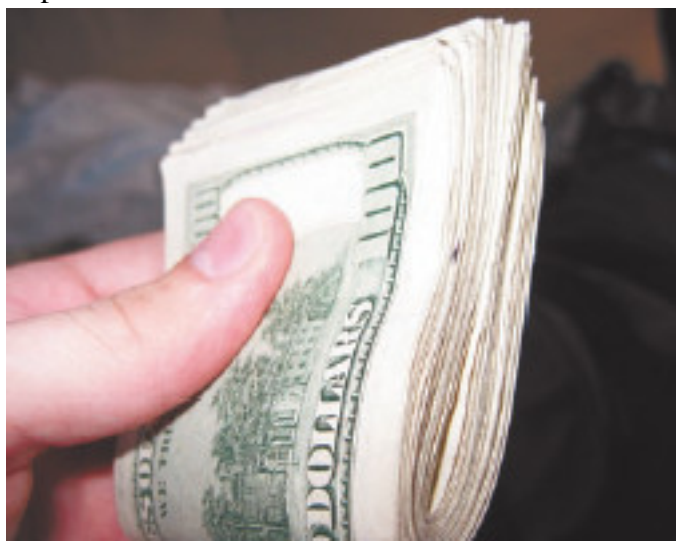
Рис. 1.17. Не стоит говорить продавцу, что у вас при себе определенная сумма денег

Например, если вы не уверены, что будете покупать именно этот автомобиль, не стоит говорить его хозяину, что у вас в кармане есть столько-то денег и вы хотите купить машину именно за эту сумму (рис. 1.17). Совершенно ни к чему, чтобы посторонние знали о том, что в настоящее время вы представляете собой «ходячий кошелек».