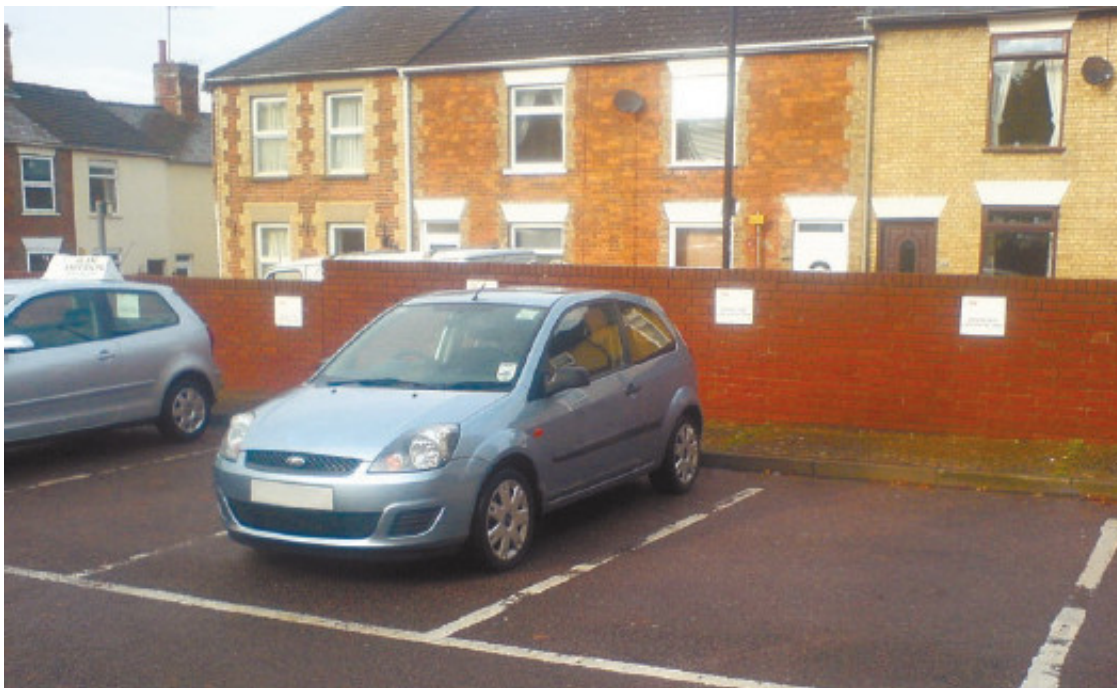
Рис. 1.20. Новому автомобилю требуется место на охраняемой стоянке

Однако, выбрав новый автомобиль, не обладая достаточными средствами и стабильным доходом, вы сделаете ошибку. Предположим, вы смогли взять кредит на покупку автомобиля. Но ведь мало машину купить, ее еще нужно содержать. А новый автомобиль требует денег буквально с первой секунды – хотя бы на установку хорошей сигнализации, ведь симпатичная машина привлекает не только вас, но и автоугонщиков. Поэтому новому автомобилю понадобится не только сигнализация, но и гараж или хотя бы место на охраняемой стоянке (рис. 1.20). А ведь есть еще парковки около магазинов, офисов, фитнес-клубов, и далеко не все они охраняемые, а вот автоугонщики как раз весьма пристально следят за такими местами – это их потенциальные «охотничьи угодья».