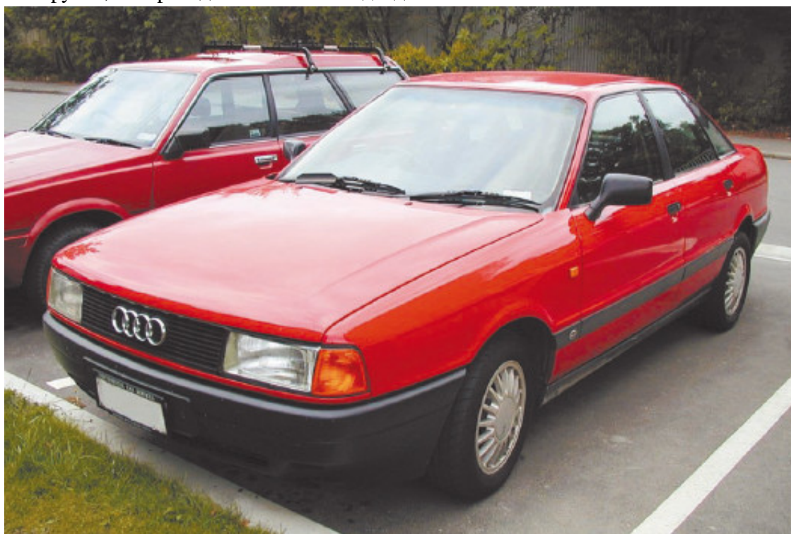
Рис. 1.2. Audi 80 – чем не мечта!

Ни одного существенного критерия, по которому должен осуществляться выбор автомобиля, названо не было. Если бы девушка, например, сказала, что всю жизнь мечтала о красной Audi 80 с двухлитровым двигателем, чтобы ездить на ней на работу и по магазинам (рис. 1.2), вопросы вряд ли бы возникли и об ошибке речи бы не было. Но просто «красная машина» – это от пожарной и до неизвестности. А в результате можно оказаться отнюдь не с тем автомобилем на руках, который действительно подходит.