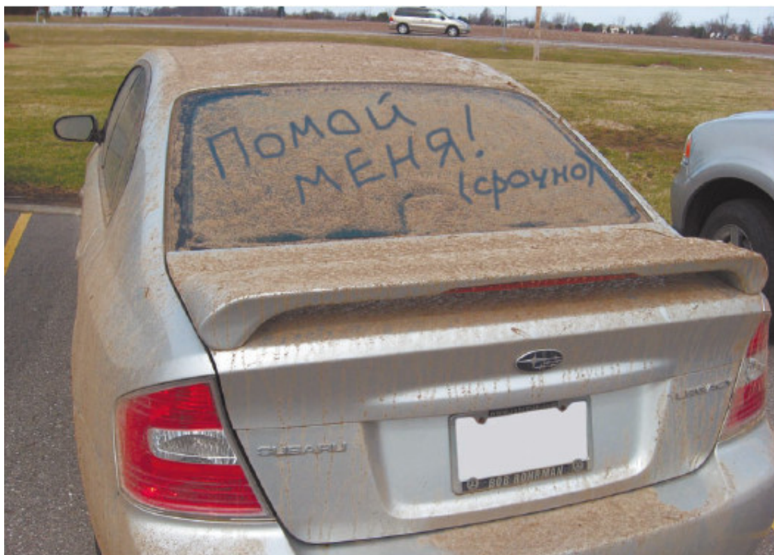
Рис. 1.22. Новый автомобиль нуждается в чистоте

Подержанный автомобиль проще и дешевле в эксплуатации и обслуживании. Кроме того, если вы – новичок за рулем, то не лучше ли для вас будет сначала «добить» автомобиль б/у, потренироваться на нем? А уже изучив на практике все нюансы обслуживания, сервиса, ремонта и эксплуатации собственного автомобиля, потом можно сделать и дорогостоящую покупку – новую, прямо с конвейера, машину (рис. 1.23).