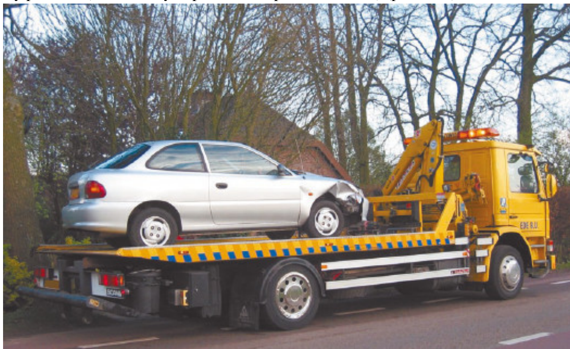
Рис. 1.16. Автомобиль не на ходу, погруженный на эвакуатор

После совершения покупки оказывается, что автомобилю требуются замена коробки передач, капитальный ремонт двигателя, диагностика и ремонт тормозной системы, замена всех фильтров и рабочих жидкостей. Кроме того, имеющаяся коррозия не убирается простой покраской, необходимы также сварочные работы. Стоимость нужных запчастей оценивается в $2500, а предварительная стоимость работ – в $1800. То есть, чтобы поставить автомобиль на колеса, необходимо выложить в сумме $5300 (с учетом тех $1000, которые были заплачены изначально). Следует учесть еще потраченное время, а также стоимость доставки автомобиля к месту ремонта (вызов эвакуатора нынче дорого обходится) (рис. 1.16).