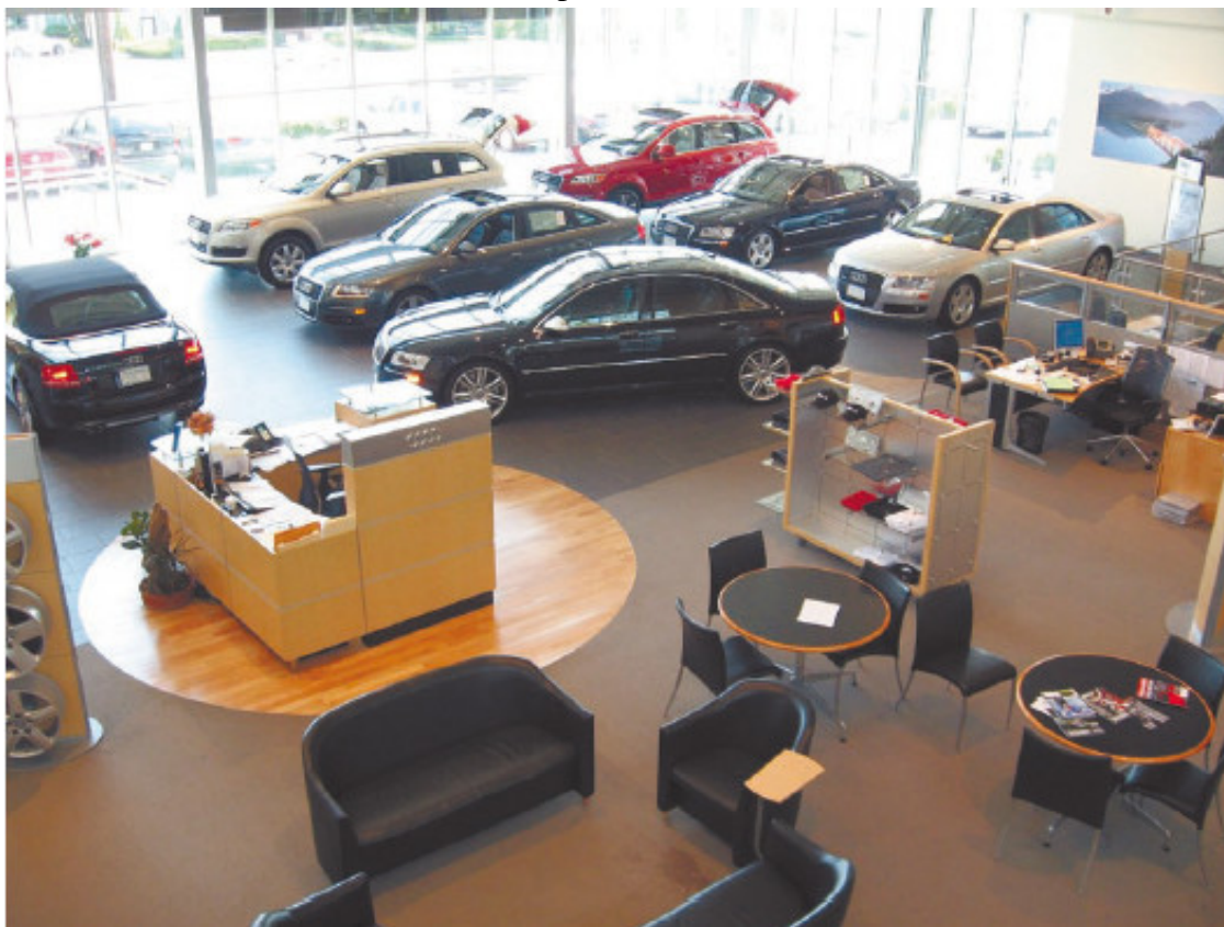
Рис. 1.5. В автосалоне тоже нужно быть начеку!

Не следует думать, что подобным занимаются только продавцы на авторынке. В автомобильном салоне могут обмануть точно так же (рис. 1.5). К примеру, вместо покрышек Bridgestone, которые были оговорены изначально, вам могут поставить покрышки Kumho, которые намного дешевле. К тому же в автосалоне обмануть неопытного покупателя гораздо проще – он загипнотизирован видом новенького, с иголки, автомобиля, он не ждет подвоха от работников салона (это ведь солидная организация, а машина стоит немалых денег!).