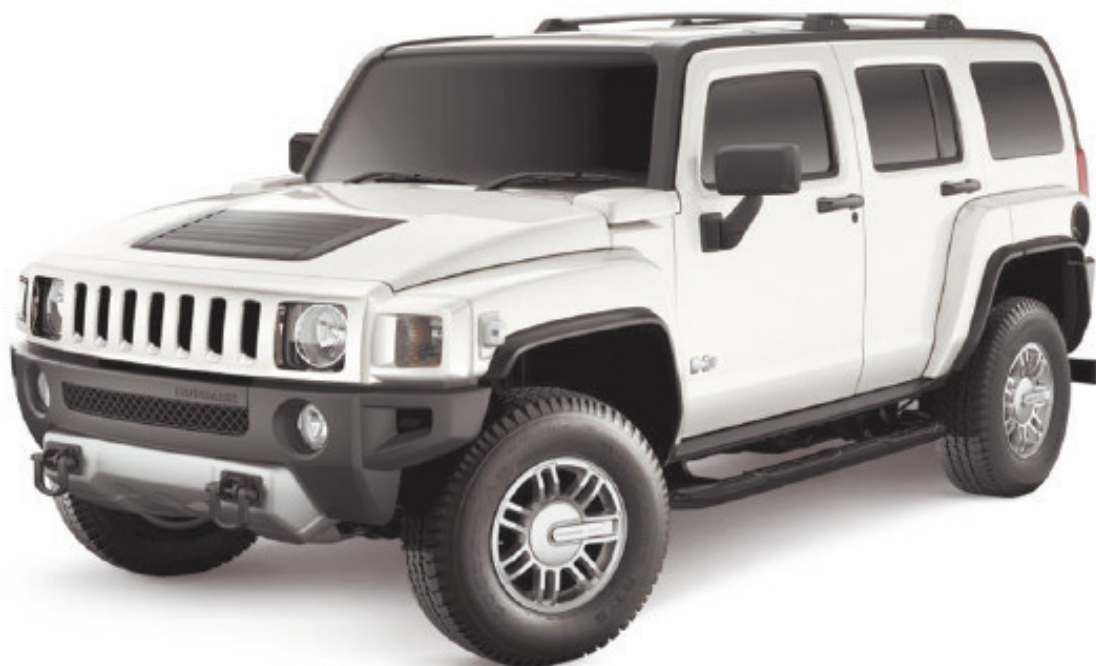
Рис. 1.4. Hummer – не лучший выбор для начинающего водителя

А ведь существует еще проблема новых и подержанных автомобилей, когда человек, доходов которого явно недостаточно для покупки новой машины, все же приобретает таковую в кредит, одолжив деньги на первоначальный взнос у всех друзей и знакомых.