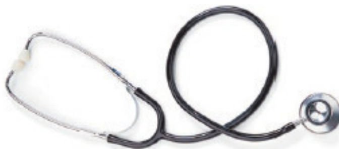
Рис. 1.15. Обычный стетоскоп может помочь в диагностике «утопленника»

В диагностике «утопленника» может помочь обычный стетоскоп (рис. 1.15): с его помощью можно услышать характерный повышенный гул подшипников всех навесных агрегатов – при «утоплении» из них вымывается смазка.