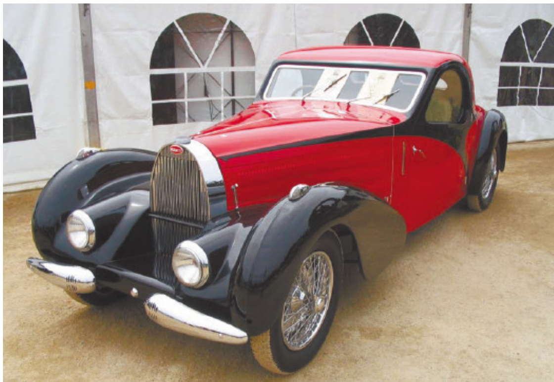
Рис. 1.25. Раритетный автомобиль с каждым годом только дорожает

Так что расчет на перепродажу – это расчет на убытки. Новый автомобиль нужно приобретать тогда, когда на нем собираются ездить.