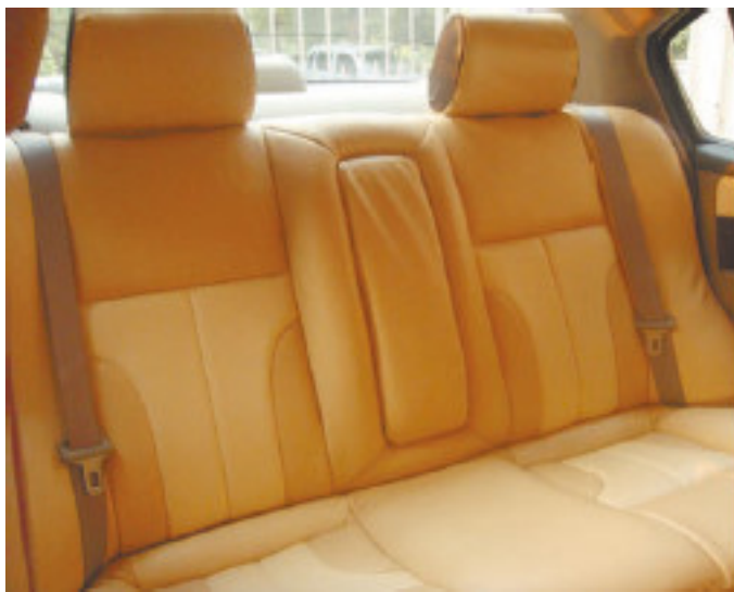
Рис. 1.10. Кожаный салон в сочетании с кожзаменителем неопытный покупатель не отличит от чисто кожаного

литрами. Вам могут сообщить, что у данного автомобиля оцинкован кузов или объем багажника больше, чем есть на самом деле. Реальное положение дел выясняется лишь тогда, когда покупатель уже проехал на автомобиле некоторое расстояние и предъявить претензии, а уж тем более вернуть автомобиль становится невозможно.