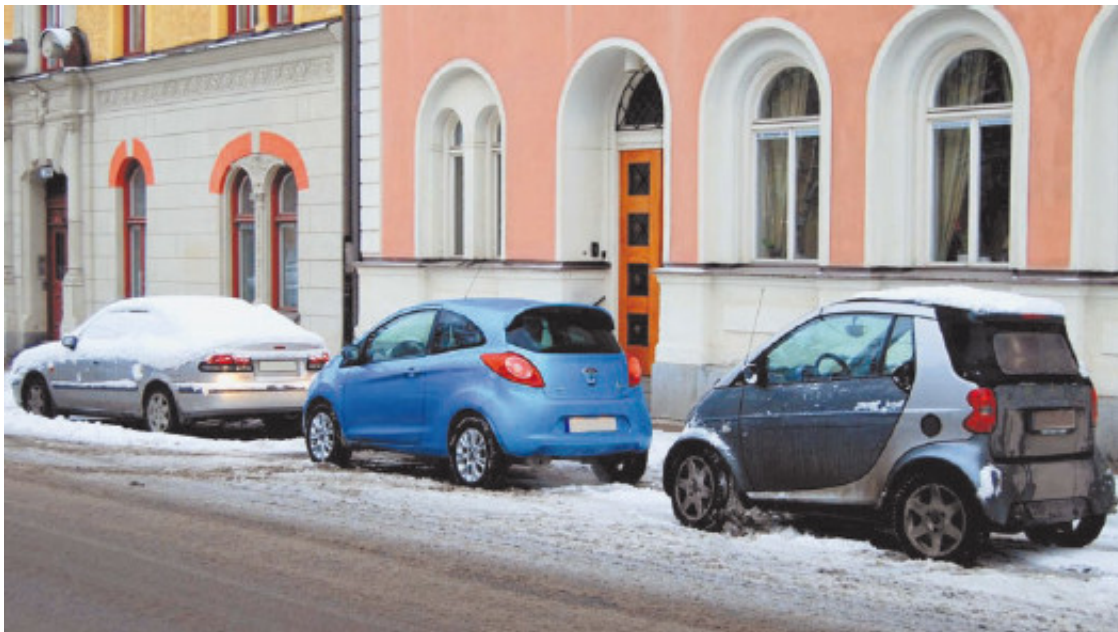
Рис. 1.3. В большом городе маленький Ford Ka (в центре) или Smart (справа) как нельзя кстати